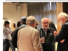
17.05.2017 Lancement de la démarche Atelier I - Information générale