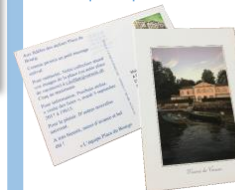
27.06.2017 Atelier II - Information / discussion avec les commerçants