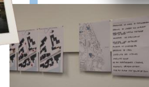
22.01.2018 Restitution du projet