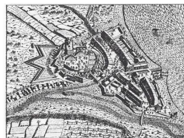
Dessin de 1590

La présence de l'eau s'inscrit naturellement dans l'histoire de ce coin de Versoix.